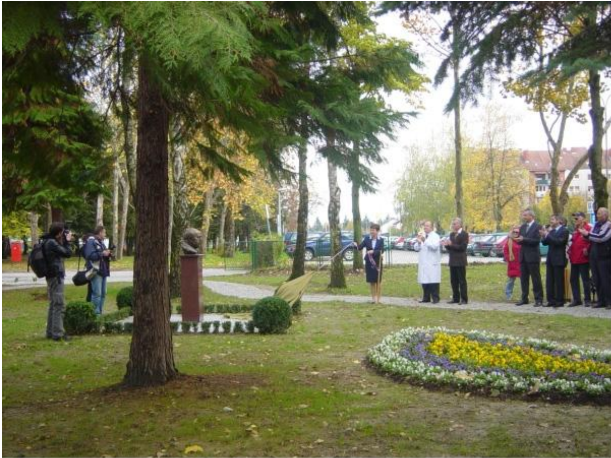
Slika 2. Otkrivanje biste