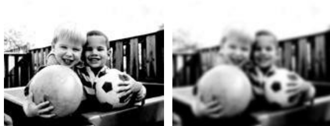
Slika kod normalnog vida i kod osobe s kataraktom.

Nemoguće je točno predvidjeti kojom brzinom će katarakta sazrijeti kod pojedinog pacijenta.